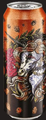
Boite 50 cl